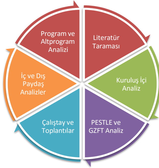
Şekil 1: Stratejik Plan Hazırlık Aşamaları

Stratejik Plan hazırlık çalışmalarının sistematik bir şekilde yürütülmesi, hazırlık sürecinde katılımın yüksek olması ve ekip çalışmasının sağlıklı bir şekilde gerçekleşmesi etkili bir stratejik planlamanın önemli adımlarından bazılarıdır.